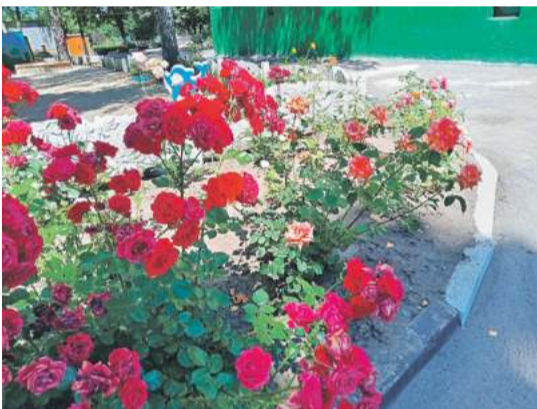
Детсад № 48 «Вишенка» г. Белгорода