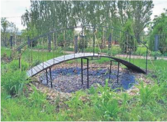
Уразовская школа № 2 Валуйского городского округа