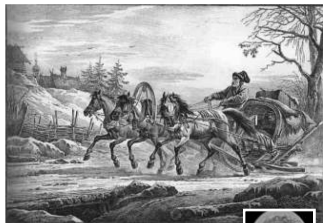
Настоящая кибитка — это крытая повозка, как на этой литографии Александра Орловского «Путешественник в кибитке, или Сани, запряжённые тройкой» (1819, Киевская картинная галерея)

Другие ученики назвали кибитку «птичкой», летящей с Кубы и крыльями поднимающей снег; «поездом, который очень быстро едет, и поэтому снег летит вверх и вниз» и даже «кибернетической, шустрой тёткой». Ямщик, по их мнению, оказался «дядей, профессия которого — таскать ящики»; человеком, роющим ямы, вероятно, карликом, «потому что сидит на чём-то маленьком и прячется в ямку».