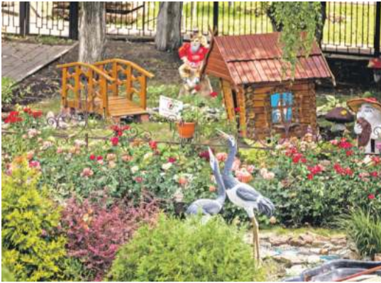
Школа № 41 г. Белгорода