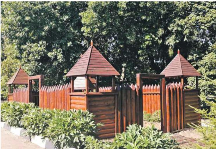
Школа № 4 г. Валуйки

Школа начинается со школьного двора. От того, как он обустроен, зависит многое. Настроение ребят и учителей. Их желание идти в школу. Адаптация первоклассников к учебной жизни. Недавно на Белгородчине уже много лет проводят конкурсы на лучшее обустройство школьных территорий. Если к делу подойти с душой, то школьный двор можно превратить и в ботанический, и в сказочный сад, и в обучающее пространство. В группе «Доброжелательная школа Белогорья» в соцсети «ВКонтакте» мы попросили учителей и учеников поделиться с редакцией фотографиями дворов их школ. И детских садов. Давайте вместе полюбуемся на нашу школьную красоту! Ну и в нашем редакционном портфеле кое-что нашлось.