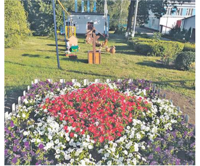
Старобезгинская школа Новооскольского городского округа