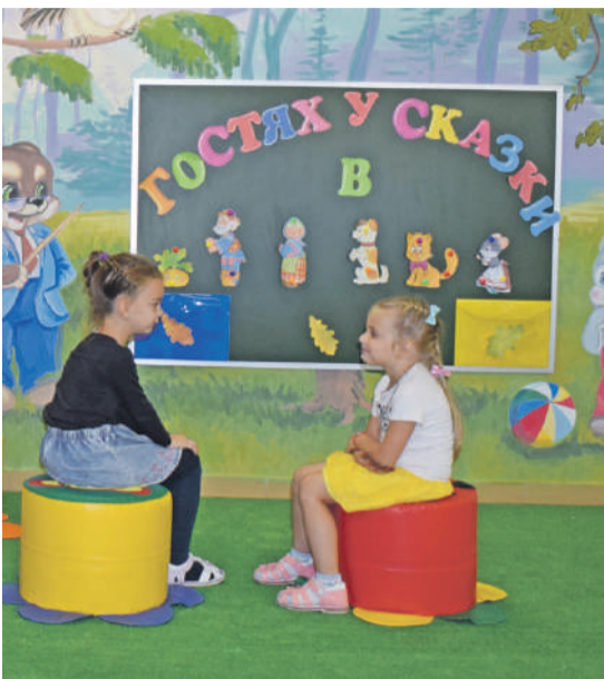
В детском саду № 4