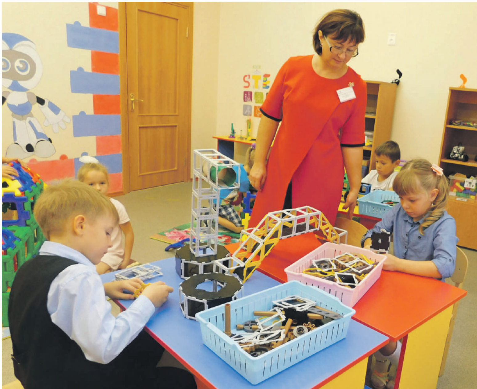
Инженерное образование малышей начинается с конструирования

Школьный технопарк позволяет создать эффективную систему профориентации, популяризировать среди школьников и их родителей востребованные инженерные и технические специальности. И, конечно, помогает выявить «техно-звёздочек» среди учеников в сетевом взаимодействии образовательных учреждений города.