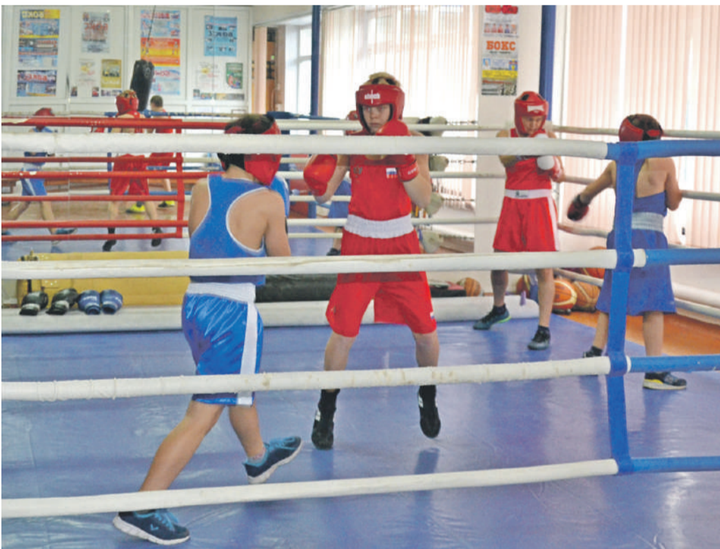
Тренировки по боксу в школе № 4