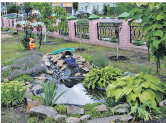
Ландшафтный дизайн на территории школы № 2