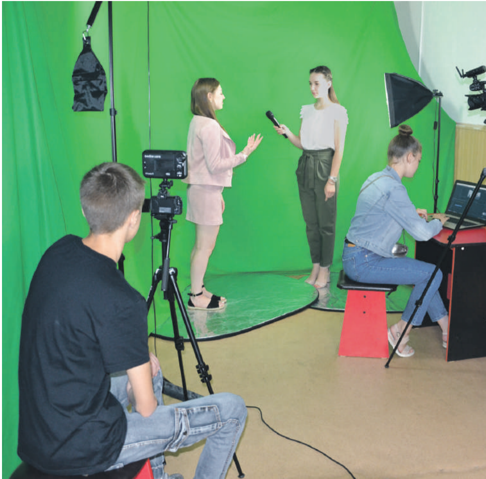
В школьном медиацентре «МедиаДикт» школы № 1