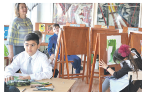
В изостудии школы № 4