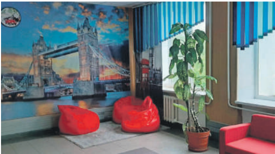
Рекреационная зона в школе № 1