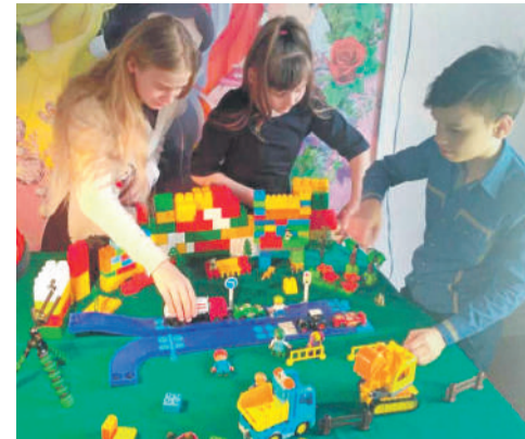
Студия мультипликации в Доме детского творчества