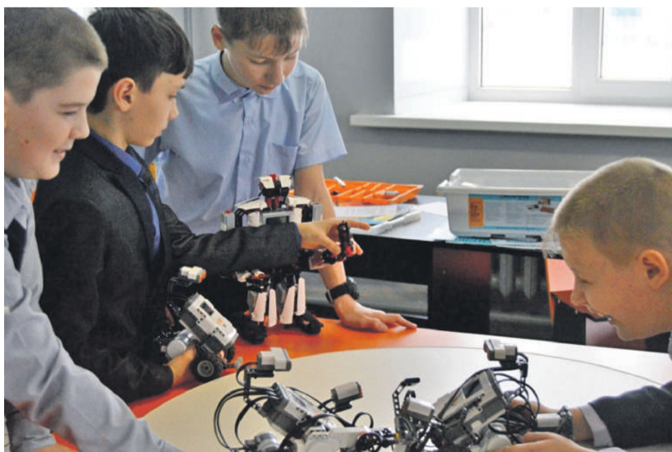
Технопарк в школе № 1

Ещё один важнейший элемент современной инфраструктуры — создание цифровой образовательной среды. Для решения проблемы взаимоотношений «цифровые ученики и нецифровые» учителя создали школьный медиаклуб «МедиаДикт».